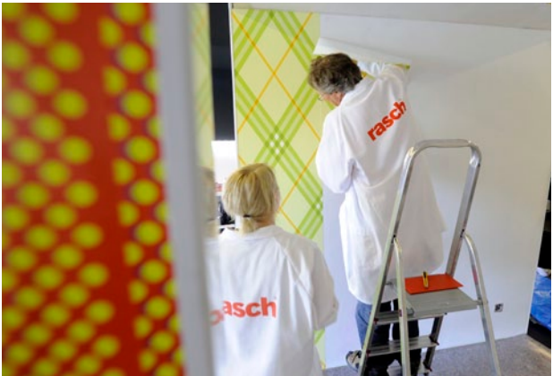
Workshop-Programme für Verbraucher und Profis