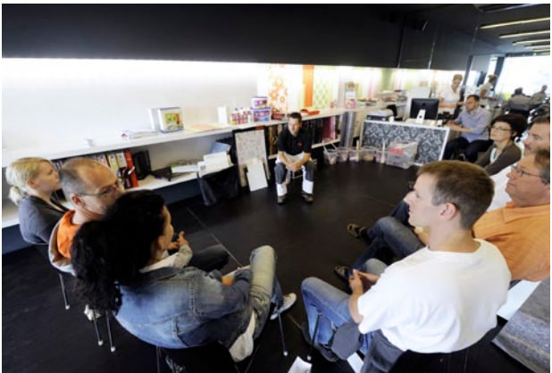
Seminare und Wettbewerbe für Maler und Architekten