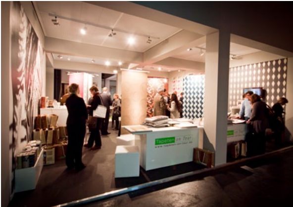
Events, Messen und Veranstaltungen