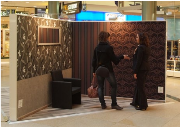
Mobile Tapetenausstellung ( www.tapeten-on-tour.de )