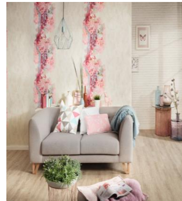
(z.B. Abb. 7: „Scandinavian Style“, A.S. Création und Abb. 8: „Free Nature“, A.S. Création)