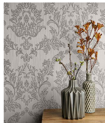
(z.B. Abb. 3: „Lof“, Marburg und Abb. 4: Textil-Tapete „Velutto“, Rasch Textil)