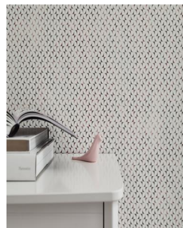
(z.B. Abb. 9: „Savoy“, Marburg und Abb.10: „GMK Fashion For Walls“, P+S )