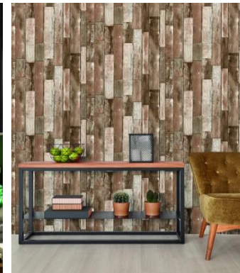
(z.B. Abb. 1: „Paradiso“, Erisman und Abb. 2: „Collage“, P+S)