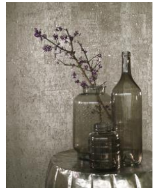
(z. B. Abb. 1: „Fashion Wood“, Erismann / Abb. 2: „Vista“, Rasch Textil)