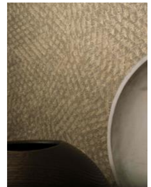
(z. B. Abb. 3: „African Queen“, Rasch / Abb. 4: „View“, Marburg)