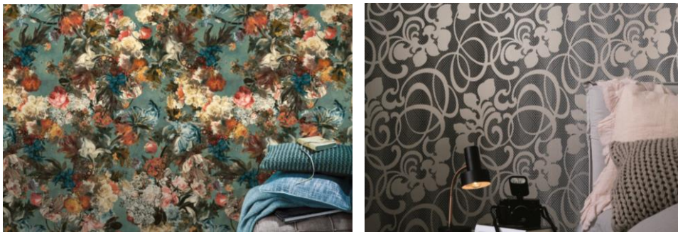
(z.B. Abb. 1.: „Passepartout“, Rasch / Abb. 2.: „Cantania“, Marburg)

Wer beim Tapetentrend Blumen an romantische Streublümchen oder verspielte Ranken denkt, kennt die Blumentapeten 2017 nicht. Angesagt sind opulente Blumenbouquets in expressiven Farben. Die prächtigen Blüten wollen auffallen und wecken mit ihrer Pracht Erinnerungen an herrschaftliche Räume. Ob als stilvoller Kontrast zu klassischen Möbeln oder in Kombination mit zeitgenössischem Interior-Design setzen diese Tapeten wirkungsvolle Wohnakzente.