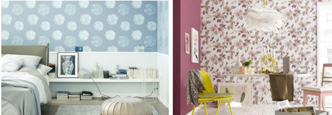
(z.B. Abb. 5: „Schöner Wohnen“, A.S. Création / Abb. 6: „Make up“, Erismann)

Florale Tapeten bringen uns und unser Zuhause in heitere Frühlingslaune. Blüten, Blätter oder fröhliche Ranken in kräftigen Farben erzeugen ein frisches und entspanntes Wohnambiente und eignen sich perfekt, um beispielsweise eine einzelne Wand zu highlighten.