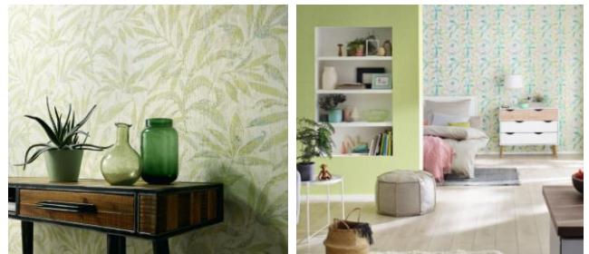
(z. B. Abb. 1: „Sevilla“, Erismann / Abb. 2: „MyMoments“, Rasch)

Wie wohnt man wunderbar entspannt? Mit Tapeten, die uns die Natur ins Haus holen. Nach dem großen Comeback der Zimmerpflanzen und der Rückkehr der Gärten in die Stadt – Stichwort Urban Gardening – holen wir uns jetzt mit grünen Tapeten und üppigem Blattwerk das Gefühl von Wald und Wiese direkt ins Haus. Dabei wirkt Grün nicht nur entspannend, sondern zugleich erfrischend. Grüntöne schaffen auch Harmonie und wirken inspirierend.