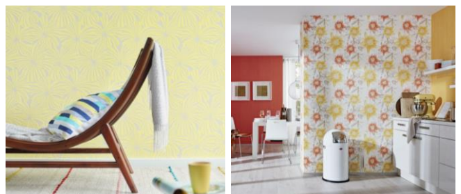
(z. B. Abb. 3: „Esprit home“, A.S. Création / Abb. 4: „Guido Maria Kretschmer / Tropical Modern“, P+S)

Die Tapetenmuster-Klassiker Blüten und Blümchen präsentieren sich in diesem Jahr in moderner Leichtigkeit. Im Mix mit frischen Streifen oder farblich abgestimmten Unis gelingt der angesagte Urban Flowers Look. Wer Farbe bekennen will, wählt zwischen fröhlichen Gute-Laune-Tönen wie Gelb und Pink oder pudrigen Pastels. Dabei gilt: Je ausdrucksstärker das Dessin, desto zurückhaltender sollte man bei der Farbwahl sein.