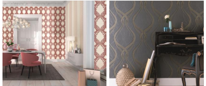
(z. B. Abb. 5: „Secrets“, Erismann / Abb. 6: „Opulence Classic“, Marburg)

Tapeten zeigen in diesem Frühjahr einmal mehr ihre ganze Wandelbarkeit. Das klassische Ornament bekommt seinen großen Auftritt und begeistert mit raffinierten Details und zeitloser Schönheit. Ob Ton-in-Ton, in edler Stoffoptik oder in cremigen Rottönen: Die neue Ornamentik macht aus jeder Wand ein Highlight und passt – ob Landhaus, Shabby oder Modern – zu jedem Einrichtungsstil.